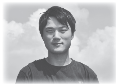
治道地区 いぬいファーム