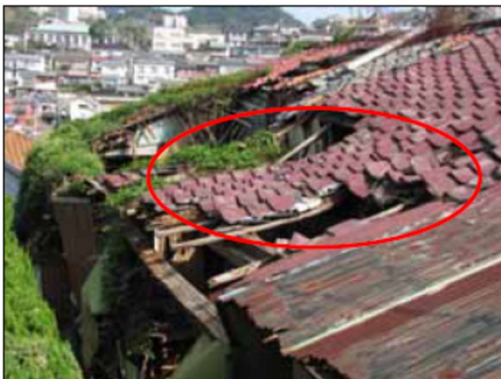
屋根、ふき材が剥落している例 (屋根ふき材、ひさし又は軒)