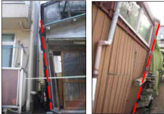
建物の傾きが明らかに確認できる例 (建築物の著しい傾斜)