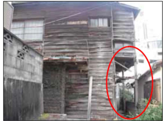
柱に局所的な亀裂やひび割れ等がある例 (柱、はり、筋かい、柱とはりの接合等)