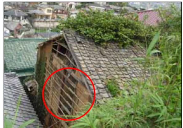
外壁の仕上げ材料が剥落、腐朽又は破損し 下地が露出している、 壁体を貫通する穴がある例 (外壁)