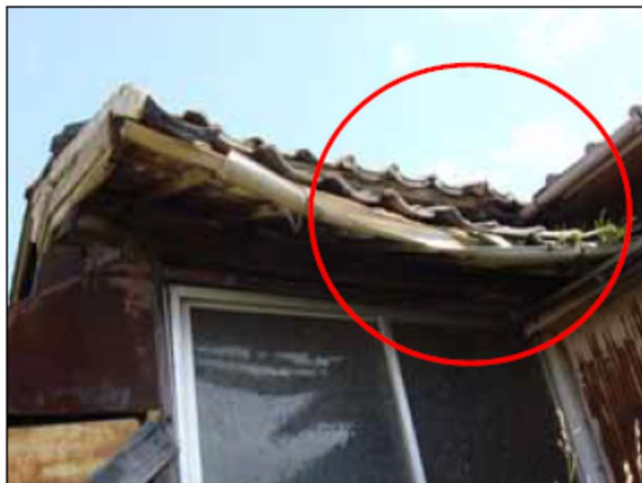
屋根が変形している、軒や雨樋が 垂れ下がっており、落下飛散の恐れがある例 (屋根ふき材、ひさし又は軒)