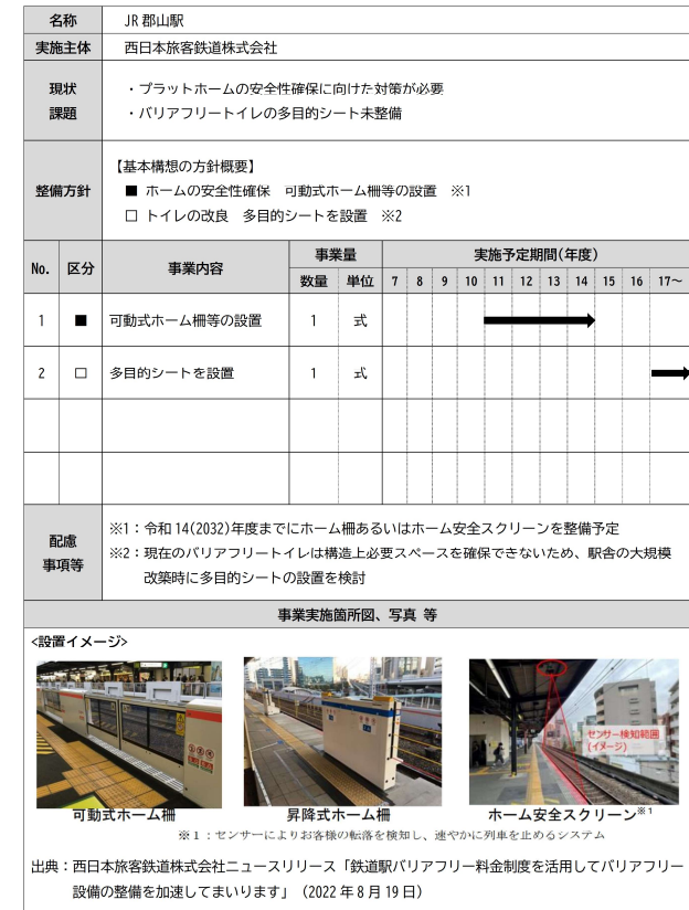
図：事業計画個票の例（JR郡山駅）