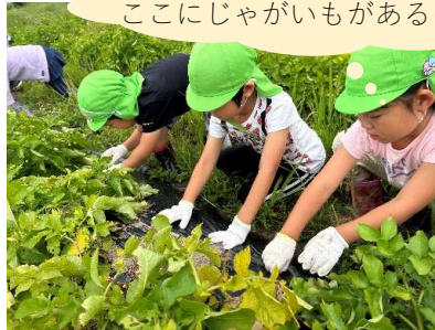
ここにじゃがいもがあるの？

地域の農家の方に来ていただき、種芋の切り口を下向きにして植えることや、その上から優しく土を掛けることを教えてもらいながら行いました。