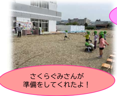
ちょっとななめになってるー！！