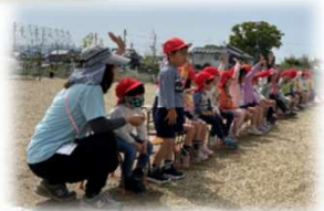
毎朝こども園では9時から朝の体操を楽しんでいます。今月は「バナナくんたいそう」と「どうぶつたいそう」です。