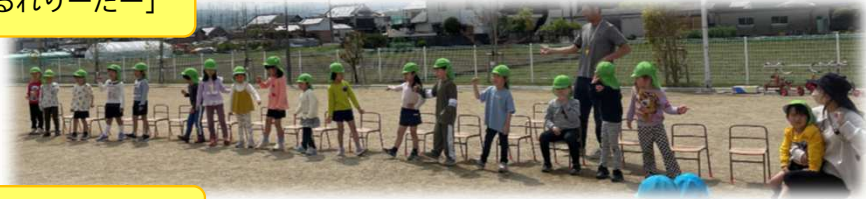
歌のプレゼント「らりるれりーだー」

今年度は4月から新しく17人のお友達が増えました。全員で99人になった平和認定こども園。みんなで園庭に集まって、5歳児さくらぐみの子どもたちが準備してくれた、「たのしいこどもえんぱーていー」を行いました。