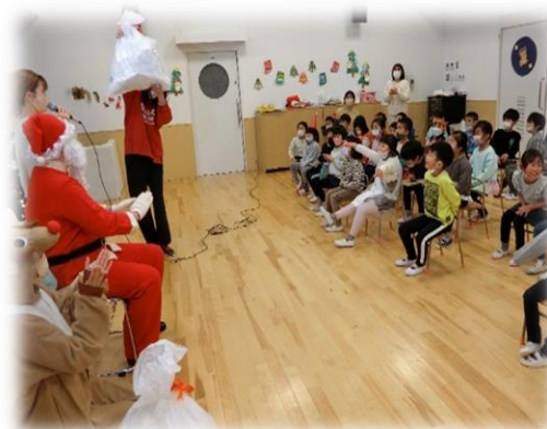
サンタさんと一緒に記念撮影！！