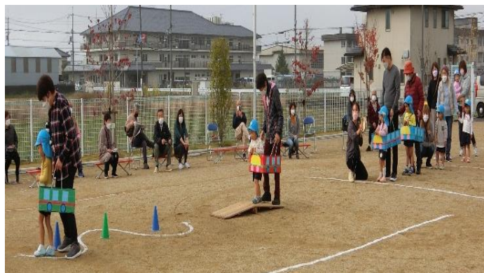
4歳児 ボール運びリレー