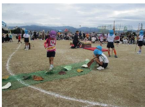
むしむし だいぼうけん

かけっこは友達と一緒に、ゴールテープ目指して最後まで思い切り走りました☆さくら組のリレーは友達と力を合わせてバトンをつないでいき、ゴールの喜びを分かち合いました。