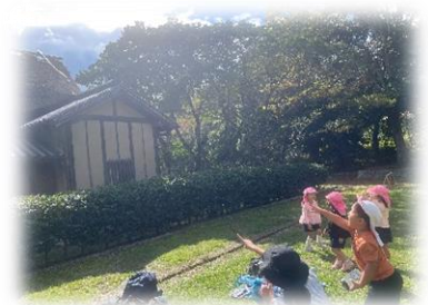
0～3歳児 矢田民俗公園～園周辺