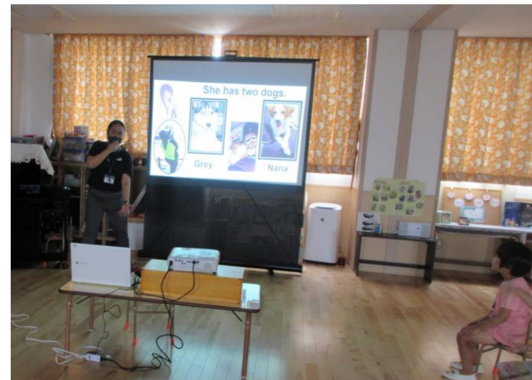
えいごであそぼう