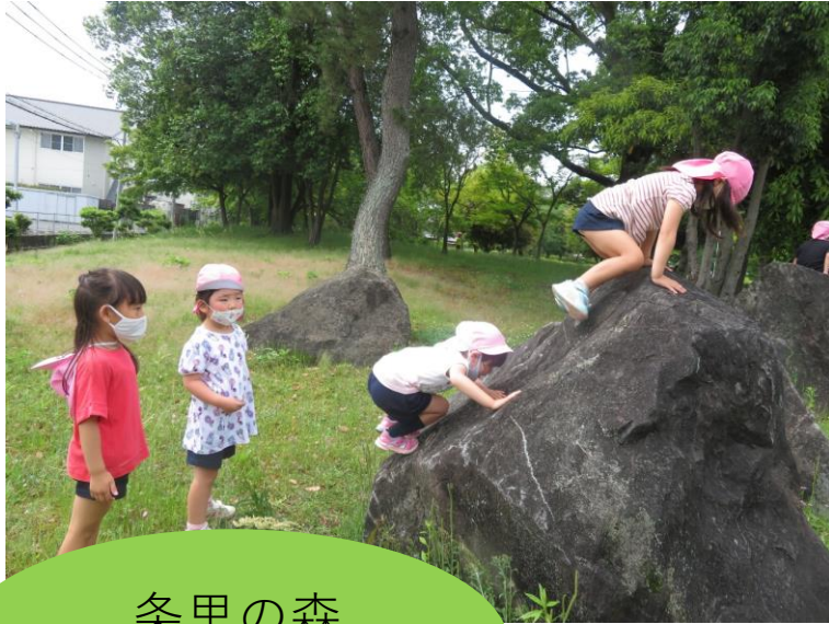
条里の森 自然物がいっぱい