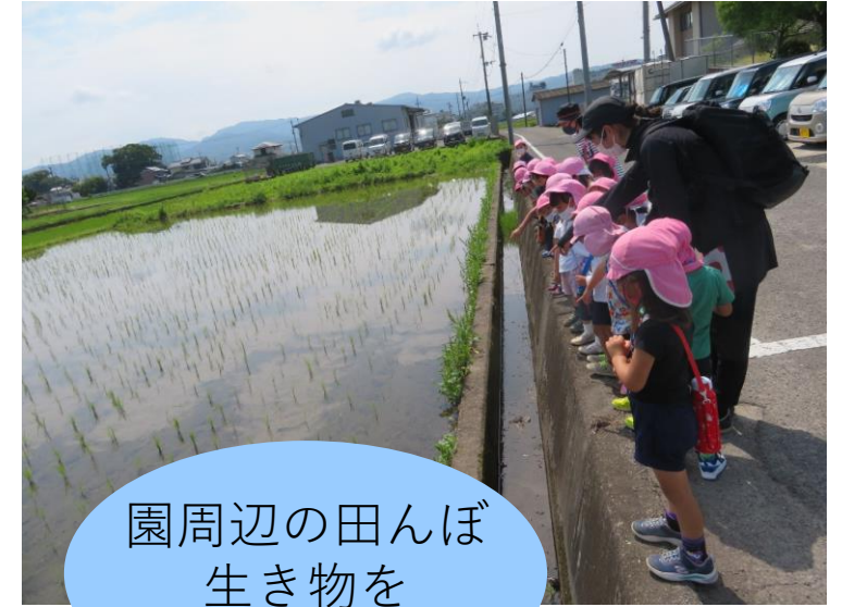
園周辺の田んぼ 生き物を みつけたよ