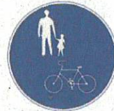
普通自転車歩道通行可