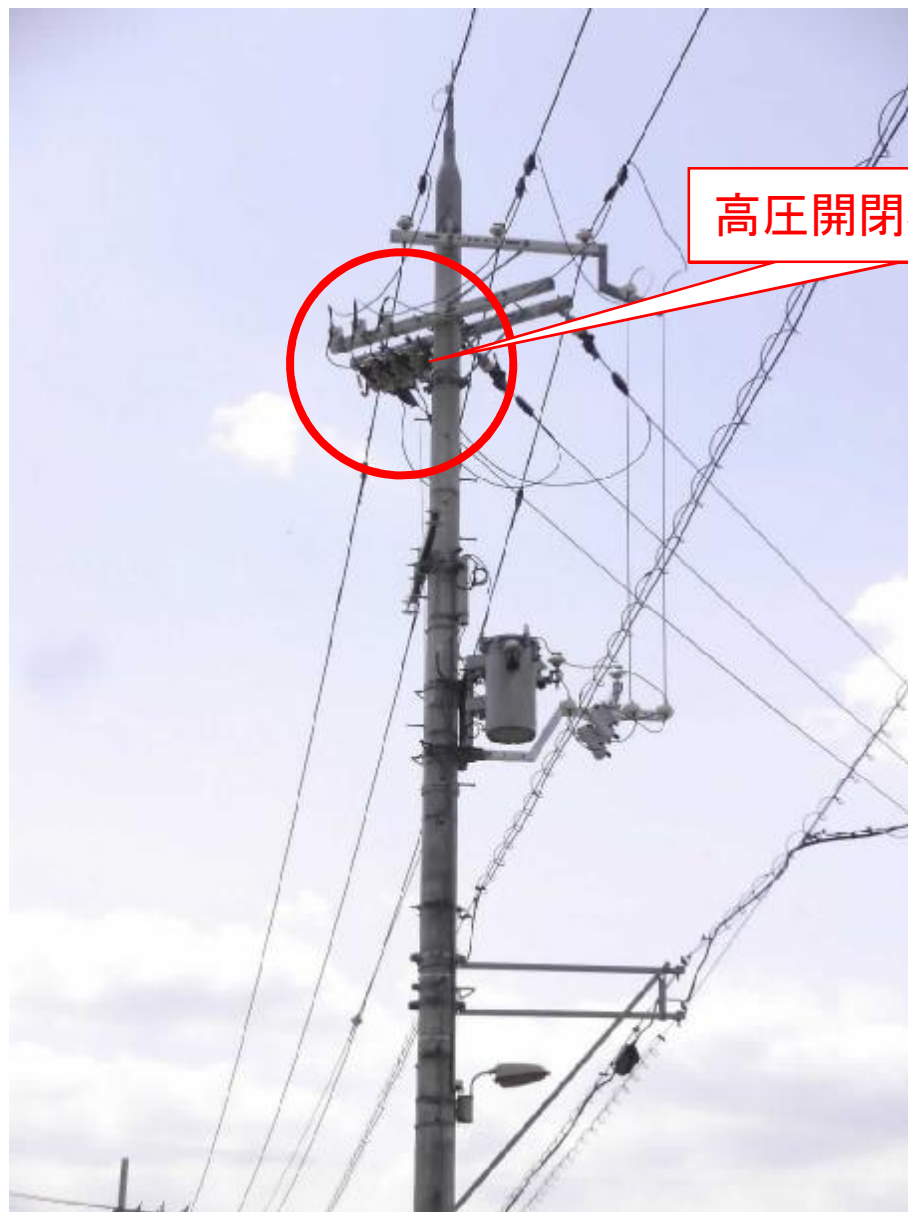
高圧開閉器 (スイッチ)