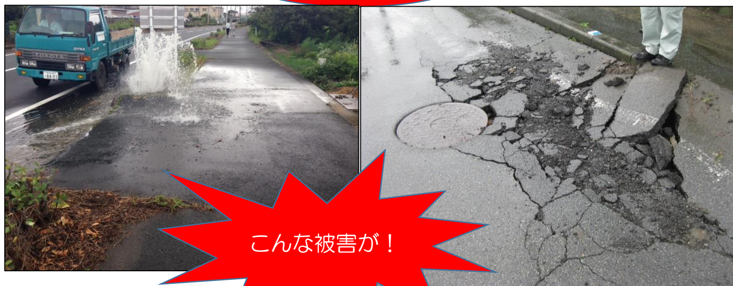
【マンホールからの下水噴出】