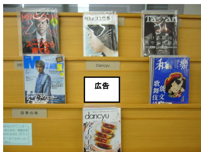
広告見本 最新号の雑誌を取ると、 雑誌架の広告が見えます。 （写真中央）