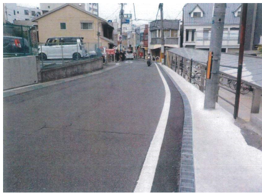
大和郡山上三橋線