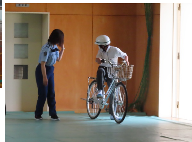
自転車のマナー向上を図る啓発活動