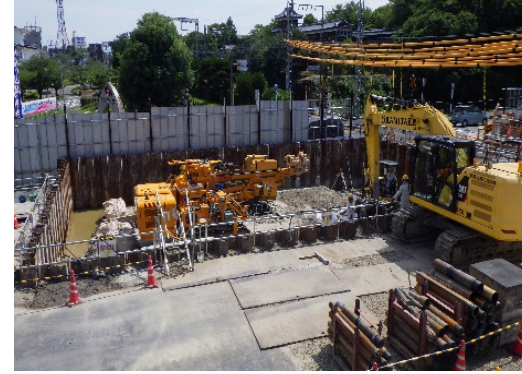
奈良大和郡山斑鳩線掘削状況