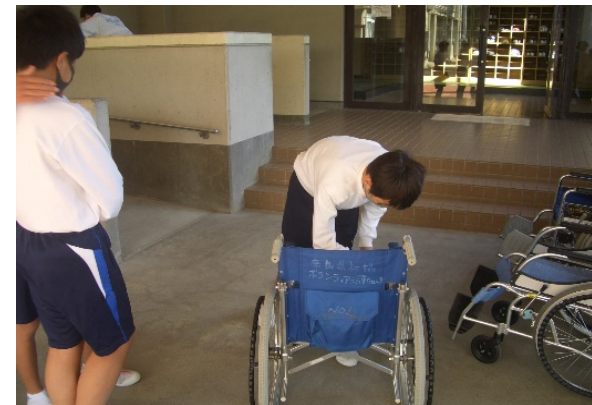
学校におけるバリアフリー教育の実施