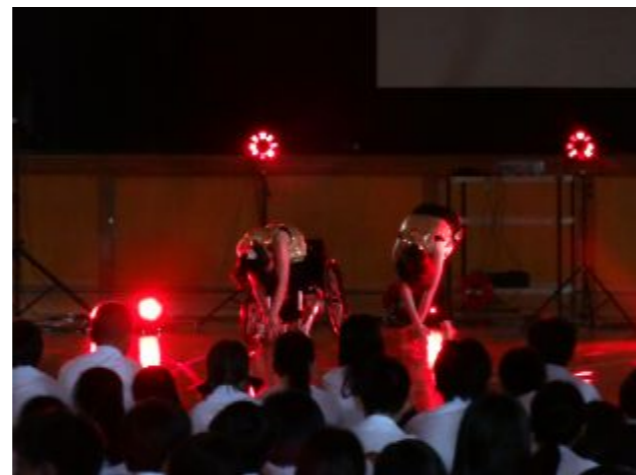
学校におけるバリアフリー教育の実施