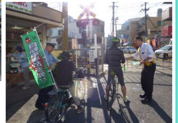
自転車のマナー向上を図る啓発活動