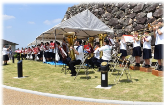
第1回水無月コンサートの様子