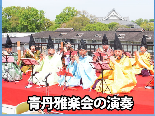
青丹雅楽会の演奏

結婚50年の節目 夫婦二人で支えあう新たな人生の門出を 郡山城天守台でお祝いいたします