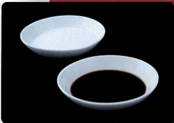
橿原市 醤油・酒・餅