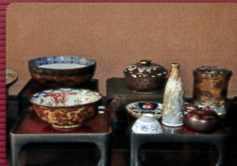
大和郡山市 御殿様御膳