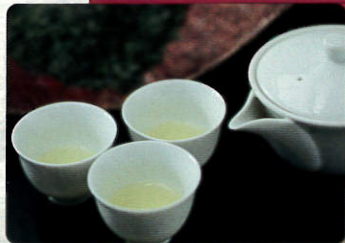
木津川市 宇治茶・たけのこ