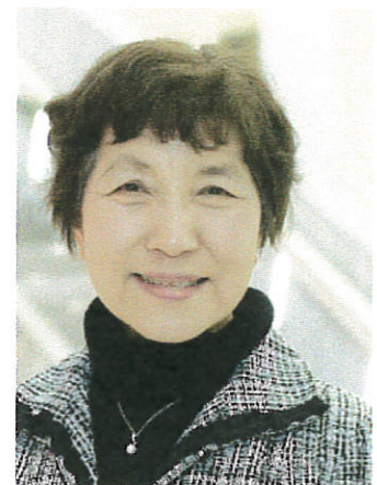
神戸学院大学現代社会学部 現代社会学科教授