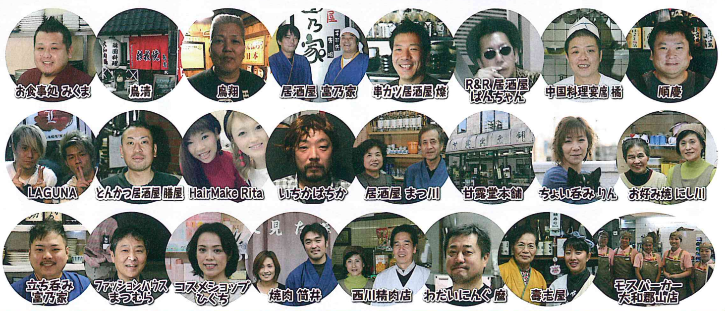
お食事処 みくま 鳥清 鳥翔 居酒屋 高乃家 串カツ居酒屋 燦 R&R 居酒屋 ほんちゃん 中国料理 宴席 橋 順慶 LAGUNA とんかつ居酒屋 膳屋 HairMake Rita いちかほちか 居酒屋 まつ川 甘露堂本舗 ちよい呑みりん お好み焼 にし川 立ち呑み 高乃家 ファッションハウス まつむら コスメショップ ひぐち 焼肉 筒井 西川精肉店 わたいにんぐ 鷹 喜志屋 モスバーガー 大和郡山店