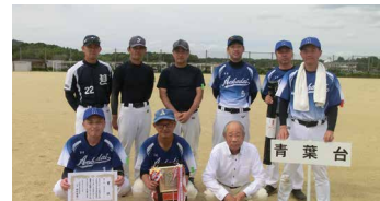
第3位 青葉台 チーム