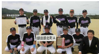
準優勝 額田部北町 A チーム