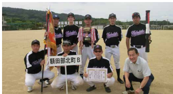
優勝 額田部北町 B チーム