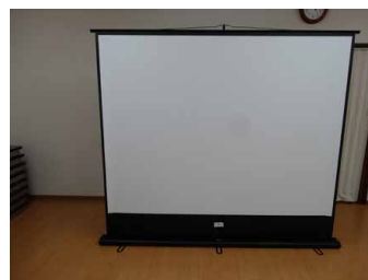
矢田山町自治連絡協議会「音響設備」