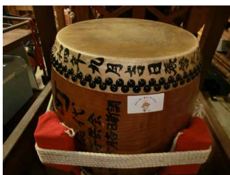
小泉北之町自治会「太鼓」

自治会のお祭りやイベントで使用し、今後のコミュニティ活動の活性化が期待されます。