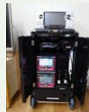
泉原町自治会 「音響機器」