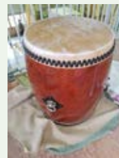
小林町自治会 「太鼓」