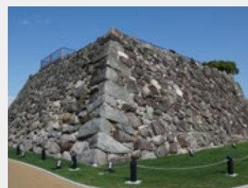
見学スポット=・城址会館西側 ・天守台下