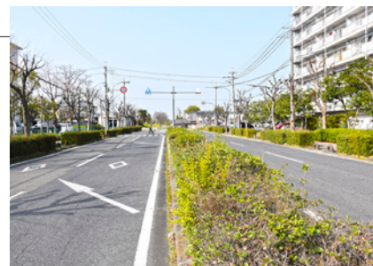
城廻り線（JR 郡山駅公団前）

新耐震基準以前に建築された消防団庫について、年次的に耐震改修又は建替えを行います。