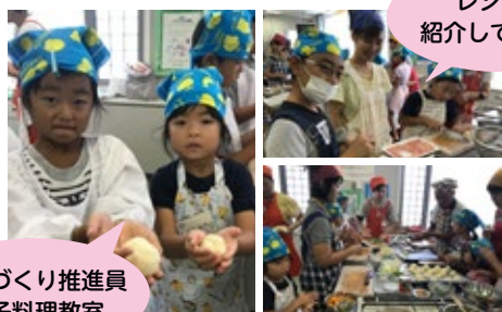
健康づくり推進員 親子料理教室

大和郡山市保健センター… 2017/08/29 【夏休み #親子料理教室 開催】 カンタンパンをはじめ、#野菜 たっぶりのハンバーグ&サラダ&スープを作りました！20組の親子（おじいちゃん・おばあちゃんも）でワイワイにぎやか楽しくできましたよ。当日の様子は9月1日 #奈良テレビ #ゆうドキッ！ #いきいきまちだよりで放送します