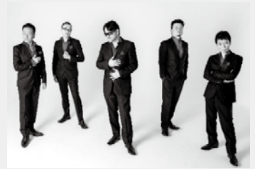
チキンガーリックステーキ