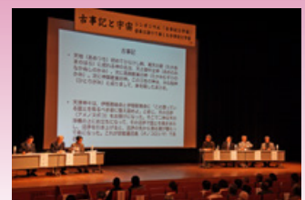
古事記と宇宙 (古事記1300年紀事業)

子育て支援の推進のため、未就学児に対する医療費助成について、県下統一による現物給付方式を導入します。