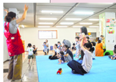
親子たんとん広場