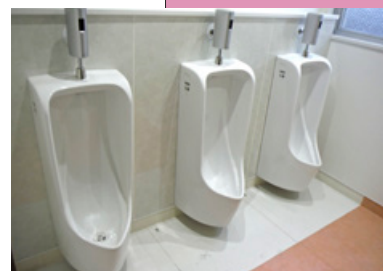
改修後トイレ(イメージ)

新 親子たんとん広場日曜日開催事業 31万2千円 たんとん広場を今まで開催のなかった日曜日においても開催し、父親の育児への参加等を促進します。