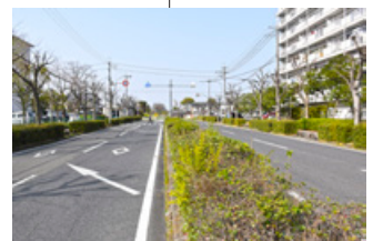
城廻り線 (JR 郡山駅公団前)