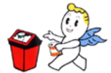
マスコットキャラクター クリンちゃん