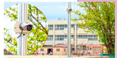
防犯カメラ設置 (イメージ)