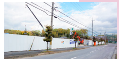
建設中の(仮称)矢田認定こども園