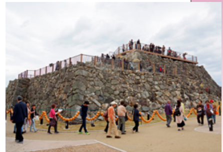
郡山城天守台展望施設