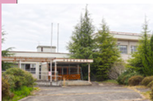
旧郡山保健所跡地（植槻町）