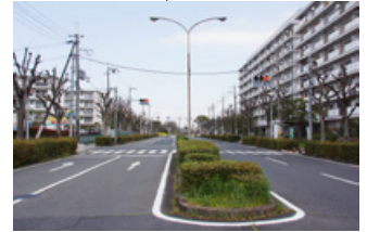
城廻り線 (JR 郡山駅公団前)

自治会で行われる自発的な防犯活動を支援するため、防犯カメラを設置する自治会に対し、その設置費用の一部を補助します。