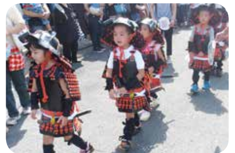
▲甲冑武者 100 人が城跡周辺を練り歩く 武者行列