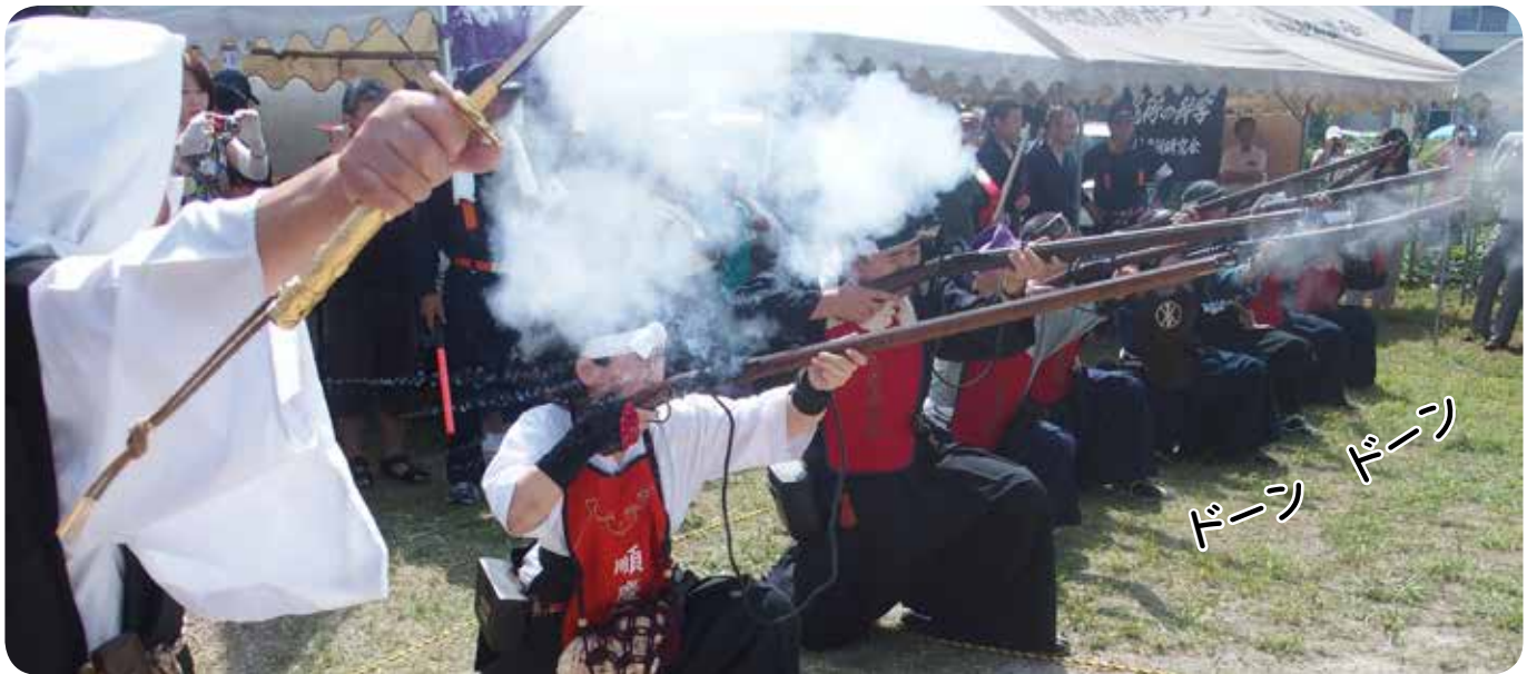
▲鉄砲隊が火縄銃で祝砲