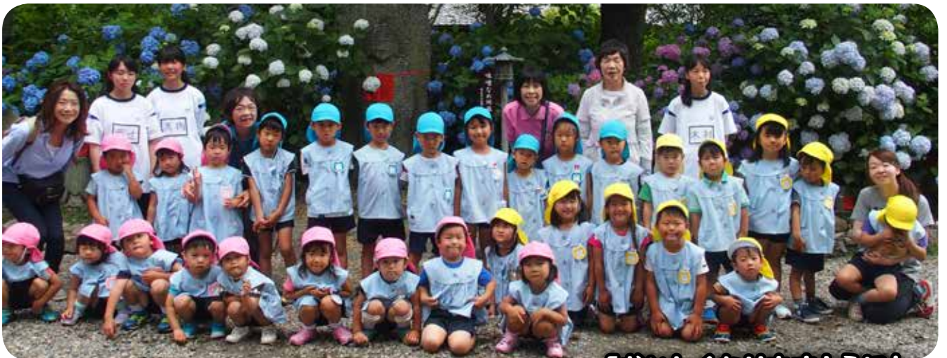
「おいしくなりますように」