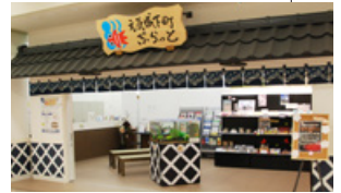
元気城下町ぶらっと