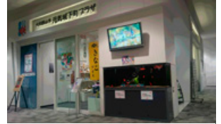
元気城下町プラザ

犯罪に巻き込まれた人とその遺族を支援するため、関係機関と協力して犯罪被害者等が受けられた被害の回復・軽減に努めます。(2・3ページに関連記事)