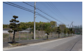
(仮称) 矢田認定こども園の建設予定地

市立図書館に司書を1人増員し、各中学校を定期的に巡回し、学校図書室の充実を図ります。