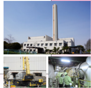
長寿命化の工事がすすむ清掃センター