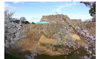
展望施設が整備される郡山城天守台