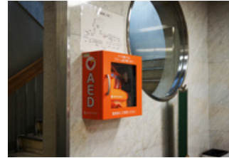
公共施設等に設置されているAED機器

AED 機器を市主要施設や学校施設だけでなく、24 時間営業のコンビニエンスストアに設置します。