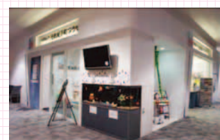
元気城下町プラザ (イオンモール大和郡山2階)