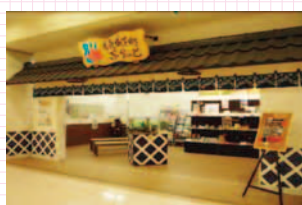
元気城下町ぷらっと (アピタ大和郡山店2階)