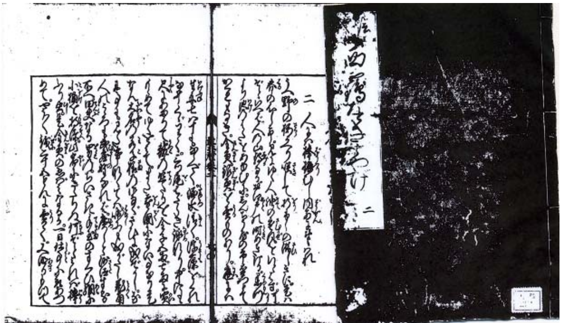
参考. 原本の該当部分

問題2 『育成動植物の趨異 すうい (The variation of animals and plants under Domestication)』は、飼育動物と栽培植物の変異・淘汰・遺伝について詳細に論述した書物である。本書で、著者は「動物が自然の生活環境から離れると変異すること、及び淘汰を利用すると新品種の育成ができること」の一例として、金魚をとり上げて解説している。イギリスの博物学者である本書の著者は誰か。次の①～④のうちから正しいものを一つ選べ。