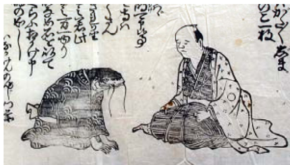
「豊田家文書」整理番号59 (大和郡山市教育委員会所蔵)

問題22 江戸時代、郡山藩のお殿様は参勤交代といって江戸と郡山を一年おきに往復することが決められていました。およそ何泊して郡山から江戸まで行きましたか。つぎの①～④のうちから正しいものを一つえらびなさい。