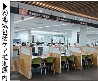
⑥地域包括ケア推進課内

住所：大和郡山市北郡山町 248-4 (大和郡山市役所 1階 ⑥番) 問合せ：電話 55-7733 (直通) 53-1151 (内線582~584) FAX 55-6831 相談時間：月曜日～金曜日(祝日・閉庁日を除く) 8時30分～17時15分