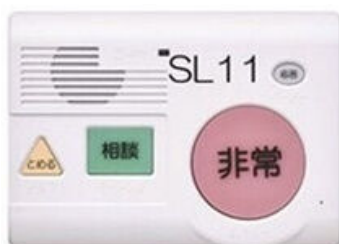
緊急通報装置機器本体