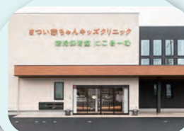
病児保育室「にこる一む」