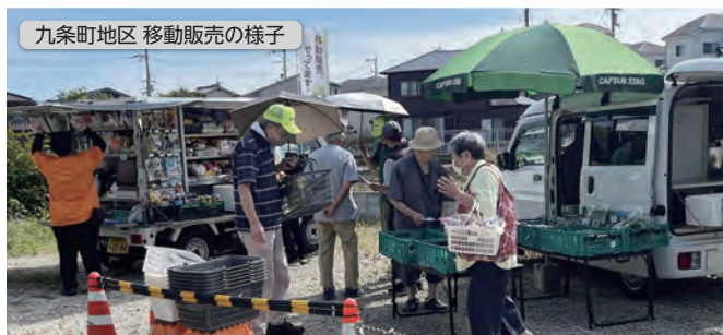
九条町地区 移動販売の様子

市では、「安心して住み続けられるまちづくり」を目指し、徒歩での買い物が困難な地域で、「公民連携買い物支援ネットワーク事業」を行っています。市・民間事業者・自治会の三者が相互に連携して、地域の広場や公園、公民館などの公共的な空間を利用し、移動販売を実施することで、徒歩圏内での買い物を支援する事業です。