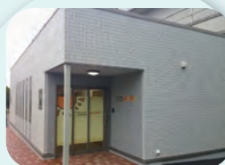
病児保育園「のびのび」