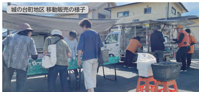
城の台町地区 移動販売の様子