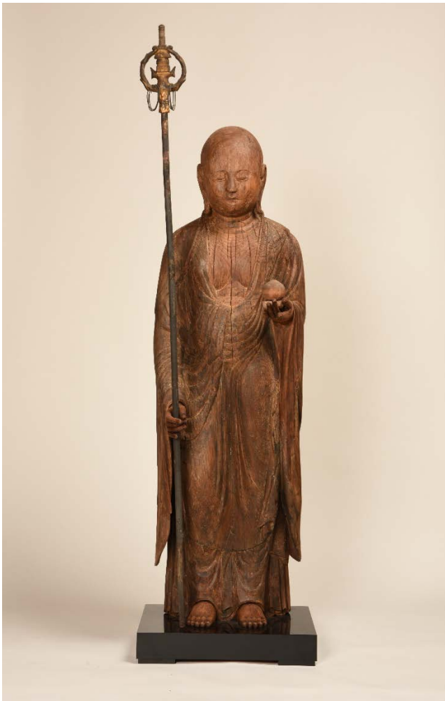
釋尊寺木造地藏菩薩立像 全身