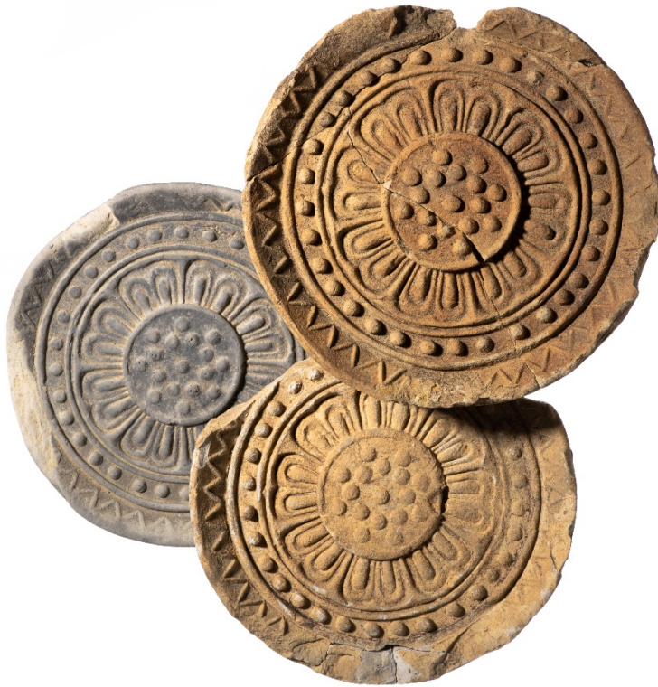
西田中・内山瓦窯の軒丸瓦