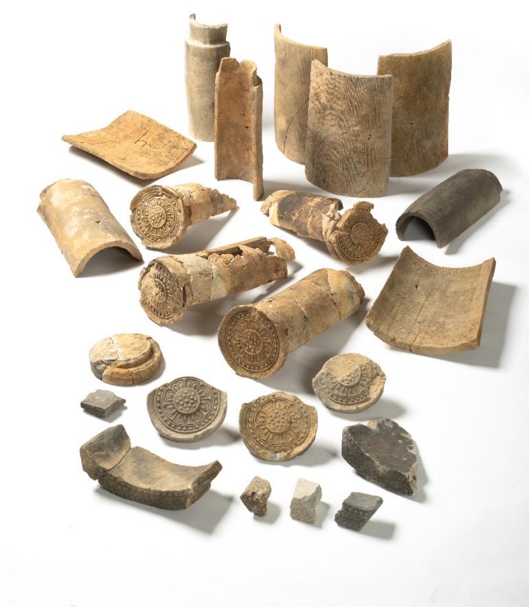
西田中・内山瓦窯出土品

※ 藤原宮…694年に遷都。造営に要した瓦は膨大な量であり、奈良盆地周縁のみならず、近江や和泉、讃岐など広範囲に生産地が分布する。