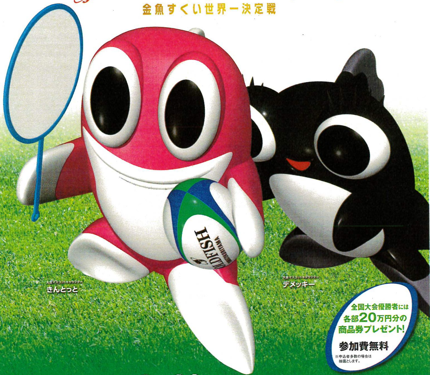
大会マスコットキャラクター ぎんとっと