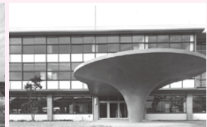
マッシュルームコラム