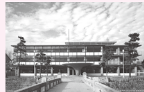
百寿橋からの前景

この度、株式会社山田守建築事務所から当時の写真を提供いただきましたので一部掲載します。